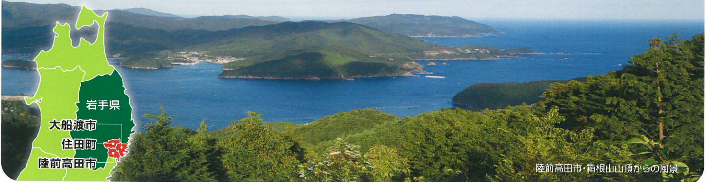
陸前高田市・箱根山山頂からの風景

今後は震災からの完全復興に向けた中心市街地におけるにぎわいの創出が期待されます。