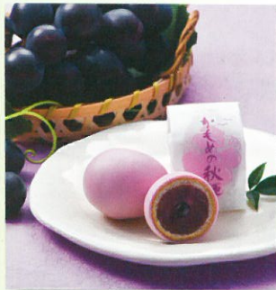
かもめの秋便りぶどう

貴方のもとへかもめが運ぶ旬の味わい。ゆたかに実ったまあるい玉子が、秋をお届けいたします。幸せを呼ぶ、ぶどうをイメージし、中央のペースト、餡、カステラ生地、ぶどう風味チョコでコーティングいたしました。