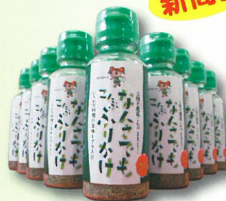
なんざでもこんぶふりかけ